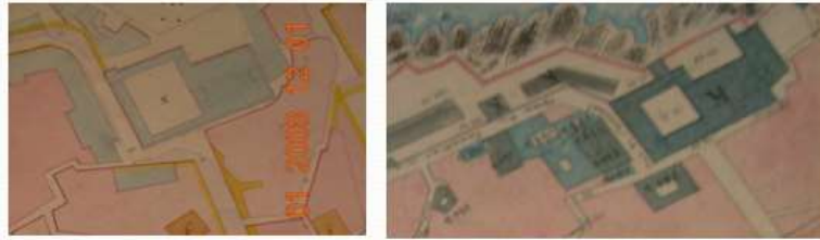
Fig n° 01 : Le projet Transformation volumique de la mosquée entre 1833 et 1845.