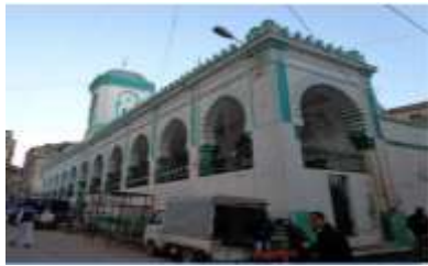
Photo n°05 : Djamâa Salah Bey à Annaba.

La couverture : se caractérise par la présence d'une seule coupole centrale disposée en avant du mihrab accompagnée de coupolettes hémisphériques (tradition ottomane).