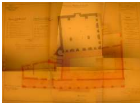
Fig n°02 : Plan de la mosquée du Bey portant les modifications à apporter.